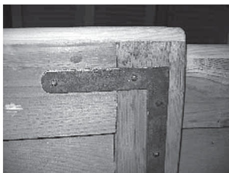
Ansicht der Flanschseite (oben)