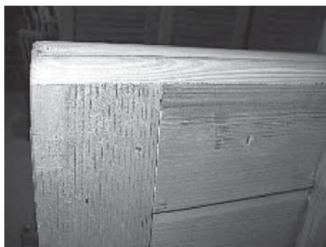
Längsfries oberkantig Offen

Bei Holz-Fensterläden, die mit Längsfries bis Oberkante verlaufen, sprich an der Stirnseite (oben) verleimt sind, besteht ein grosses Risiko, dass durch Risse Feuchtigkeit in die Spalte zwischen Längsfries und Querfries eindringt und das feuchte Holz die Grundierung sowie Vor- & Decklack aufreisst. Das Resultat ist, dass der Fensterladen an diesen Stellen verfault und – falls keine Reparatur vorgenommen wird – der Laden nicht mehr reparierbar sein könnte und durch einen Neuen ersetzt werden muss.