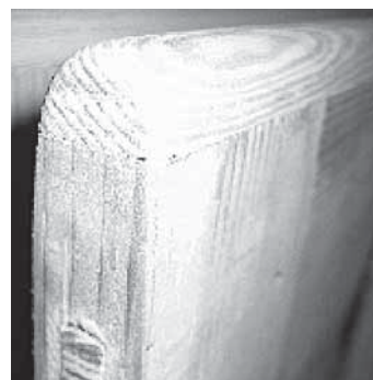
Seitenansicht mit verleimter Deckleiste